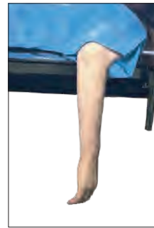
HALFネルソン肢位(上) ホールドアップ肢位(上) 下垂肢位