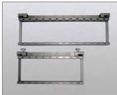
本体 上：スタンダード 下：ショート