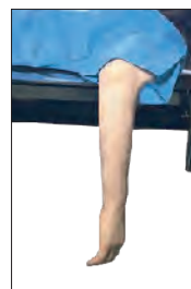
ハーフネルソン肢位(上) ホールドアップ肢位(上)