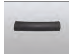
シリコンスポンジ