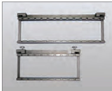
本体 上：スタンダード 下：ショート