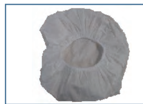
マットカバー角型マットL