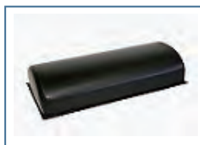
テンダーパッドかまぼこ型