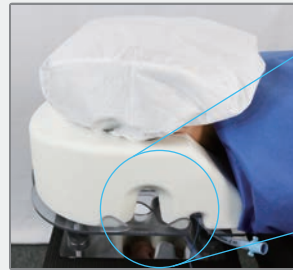
患者の様子や挿管チューブの状態を確認できます。