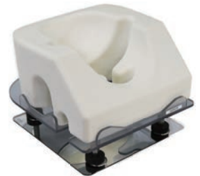
Mラックとミラー使用例