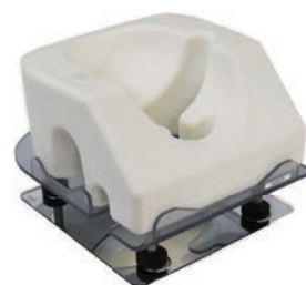
Mラックとミラー使用例