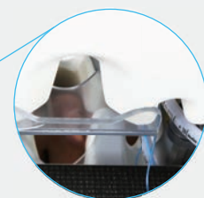
患者の様子や挿管チューブの状態を確認できます。