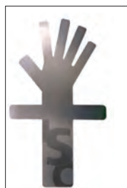
ハンドラープレート