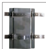
ハンドラーベース