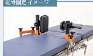
恥骨固定 イメージ