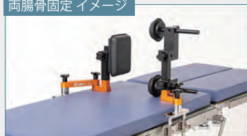
両腸骨固定 イメージ

※骨盤部前方の胸受けマットの組み方によって「両腸骨固定」と「恥骨固定」が可能です。