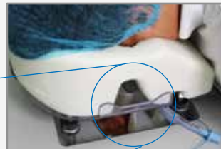
患者の様子や挿管チューブの状態を確認できます。