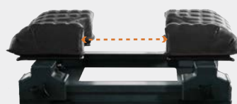
調節巾 : 0 ~ 210mm