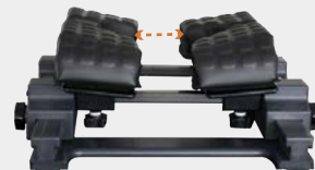
調節巾 : 0 ~ 110mm