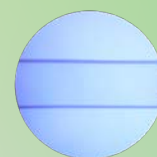
イソLT-2000LPスライドバー