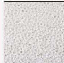
普通のウレタンフォームの表面 (気泡が粗くざらついている)