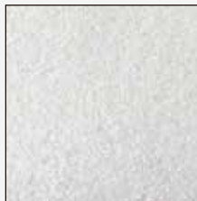
『サスティーン』の表面 (きめが細かくスムーズ)