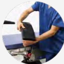
アームプレートの動き