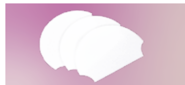
サスティーン フェイスフレーム用

通気性と透湿性に優れた素材を使用した専用マットカバー。特殊な二層構造で皮膚の摩擦、ズレを軽減します。