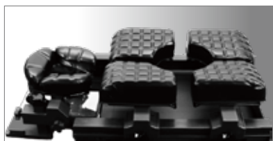
セッティングイメージ

LTシリーズと組合せてのご使用をおすすめいたします。詳細は各製品のカタログをご覧ください。