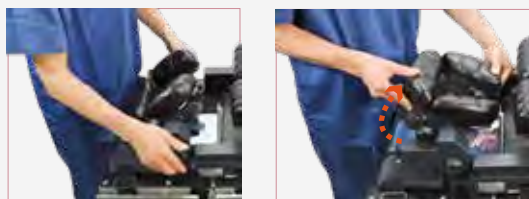
角度調節範囲:35°以上可能