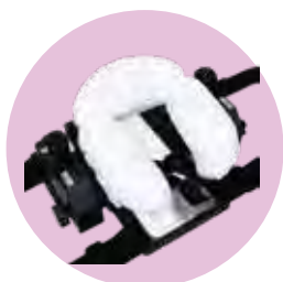
マットカバー・サスティーン使用例