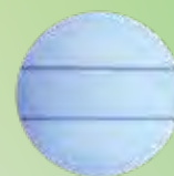
インソLT-2000LPスライドバー