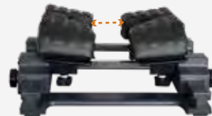
調節巾 : 0 ~ 110mm