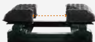
調節巾 : 0 ~ 210mm