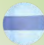
従来のLTスライドバー