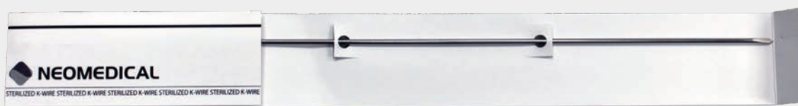
1本ずつの単包滅菌