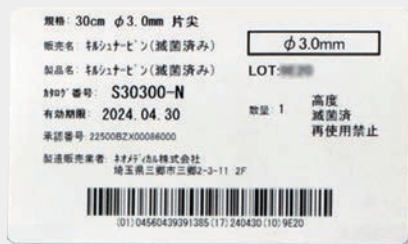
1本ずつの患者シール付