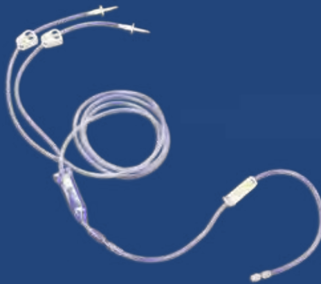
フラッシュ用チャンバー付