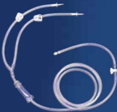
バルブ・チャンバー付