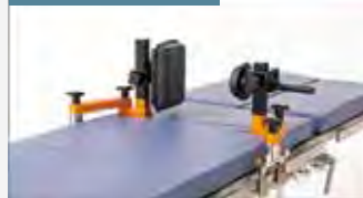
患側大腿部を最大限に可動させることができます。