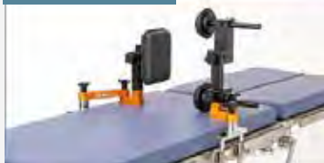
腰部の確実な固定が可能です。