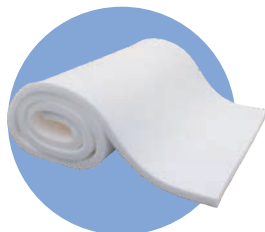
マルチユース・シート 「サステイーン」

通気性・透湿性に優れた肌触りのよいシート。 身体を優しく包み理想的な体位を実現します。 ※サイズバリエーション: 5種類 (5/10/20/30/40mm)