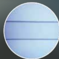
現行のスライドバー