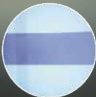
従来のスライドバー

新たに四点支持プレートを支えるスライドバーに X 線透過性に優れた炭素繊維強化プラスチック (CFRP) を採用。内部を中空にしたことで、従来に比べてよりクリアな画像で観察いただけます。