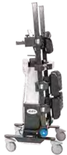
コンパクトな収納が可能

イソKMPプラスは様々な手術台に接続して、Cアームのアクセスを最大限に引き出すことができるシステムです。