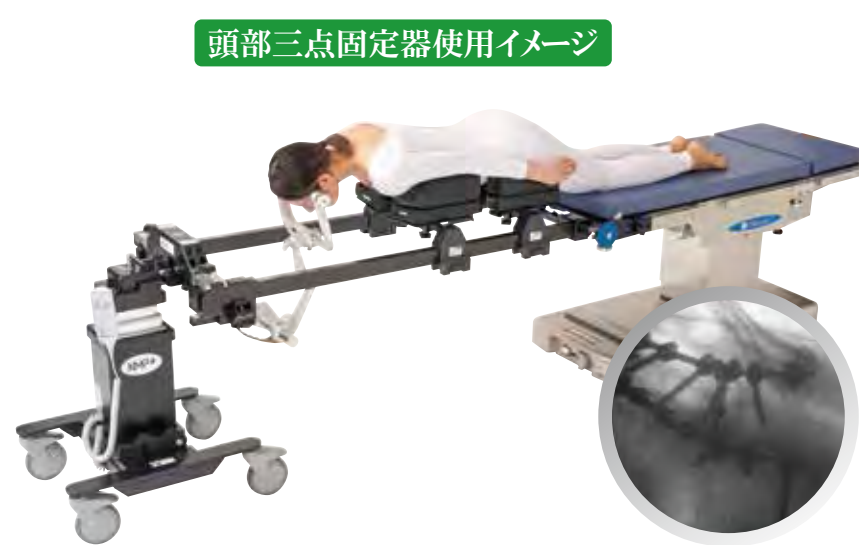
頭部三点固定器使用イメージ