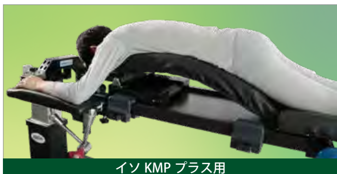
イソ KMP プラス用