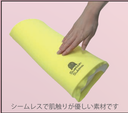
シームレスで肌触りが優しい素材です

患者の状態や体格に合わせて硬さ(柔らかさ)を調整でき、肌(皮膚)のずれ・摩擦を緩和し、接触部位に汗を留めない低刺激性パッドです。