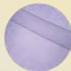
カーボンアームシャフト使用時